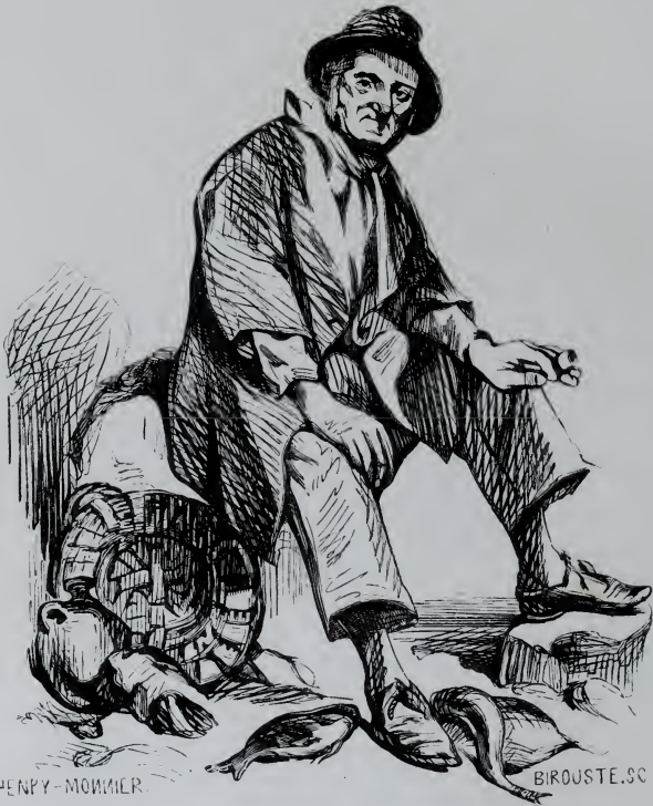
Le Pêcheur des Côtes.